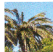
palmes juvéniles cassées ou absentes